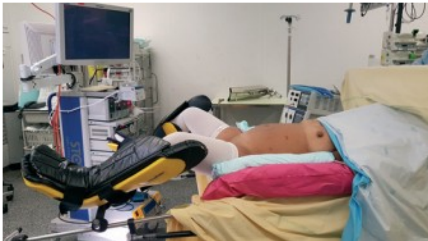
Installation coelio